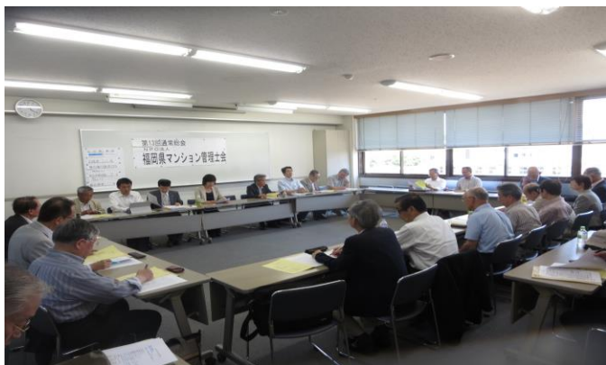
NPO 法人第 1 3 回通常総会