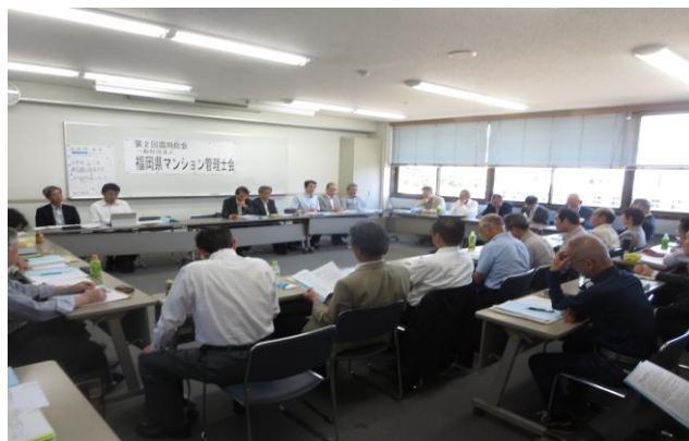
一般社団法人第 1 期第 2 回臨時総会